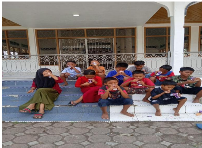
Gambar 1 Hasil Observasi Minuman Ringan

Berdasarkan hasil observasi ditemukan bahwa anak-anak di Desa Lamcot, Kecamatan Darul Imarah, Kabupaten Aceh Besar selalu mengonsumsi minuman ringan dengan tingkatan konsumsi yang tinggi. Observer melihat anak-anak mengonsumsi minuman ringan dengan beberapa label yang berbeda.