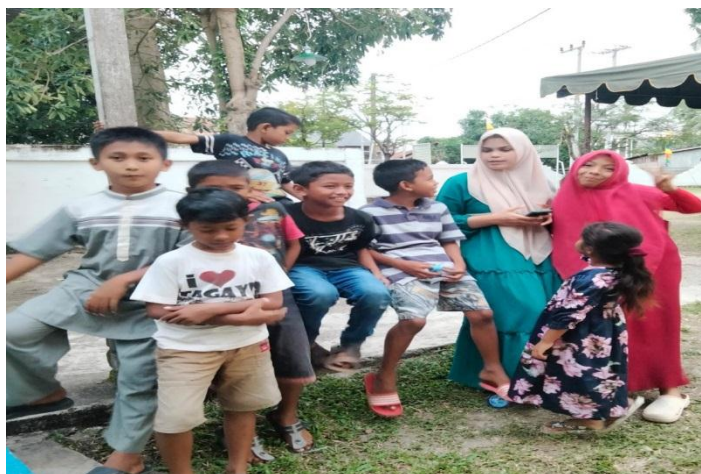
Gambar 2 Hasil Wawancara Minuman Ringan

Alasan para responden lebih memilih membeli minuman ringan adalah ketika dalam keadaan haus dan lelah setelah bermain pada siang atau sore hari. Minuman ringan mengandung kadar gula yang tinggi yang memberi efek rasa manis yang disukai oleh banyak anak-anak, selain dari rasa kemasan yang menarik juga membuat anak-anak lebih memilih untuk membeli dan meminum minuman ringan dibandingkan air putih. 4 Dari hasil wawancara dengan para responden menyatakan bahwa orang tua para responden melarang untuk mengonsumsi minuman ringan, namun para responden tidak patuh terhadap larangan yang diberikan orang tua masing-masing. Dari pihak orang tua pun hanya menjelaskan secara umum dampak negatif dari minuman ringan, misalnya sakit perut, batuk, pilek, demam, dan sebagainya.