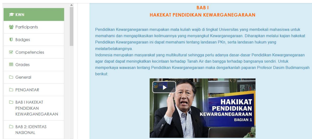
Gambar 2. Konten Materi Pendidikan Kewarganegaraan Dalam E-Learning

E-Learning juga menyebabkan pergeseran paradigma pembelajaran dari berpusat pada guru ( teacher center ) menjadi berpusat pada siswa ( student center ) (Saffudin, 2013). Dalam perkuliahan reguler tersebut, mahasiswa menjadi pihak yang lebih dominan dalam pembelajaran. Dosen hanya mengamati siapa saja mahasiswa yang sudah log in dan melakukan presensi. E-Learning sudah seharusnya diaplikasikan sebagai model pembelajaran (Zahroh, 2015).