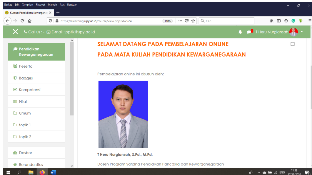
Gambar 1. Tampilan E-Learning Pada Mata Kuliah Pendidikan Kewarganegaraan

Penelitian ini dilaksanakan selama satu semester mulai 7 September 2020 sampai 18 Desember 2020 (15 kali pertemuan secara online ) dan fokus pada satu mata kuliah yakni Pendidikan Kewarganegaraan.