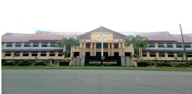
Gambar 1 Kantor Sekretariat Daerah Kota Subulussalam

Kantor Sekretariat Daerah Kota Subulussalam berlokasi di kompleks perkantoran Kota Subulussalam, Tangga Besi, Kecamatan Simpang Kiri Kota Subulussalam. Kota Subulussalam ingin mewujudkan pemerintahan yang baik dan disiplin, maka dari itu mulai membentuk sumber daya manusia yang berkualitas dengan cara meningkatkan kedisiplinan seorang pegawai di lingkungan kantor sekretariat daerah Kota Subulussalam. Untuk meningkatkan kinerja pegawai yang baik dan disiplin tentunya butuh alat penunjang untuk melihat kinerja seorang pegawai. Salah satu cara mengawasi kerja pegawai yaitu dengan absen. Absen secara manual dengan menggunakan buku absen dan tanda tangan ternyata kurang efektif untuk mendisiplinkan seorang pegawai di lingkungan kota subulussalam. Oknum pegawai yang tidak bertanggung jawab sering kali mengisi buku absen lebih dari satu hari, agar jika hari berikutnya pegawai tersebut tidak hari masih tercatat hadir di buku absen. Dan pegawai sering masuk lewat dari jam yang sudah di tentukan dan pulang juga lebih cepat dari jam yang sudah di tentukan.