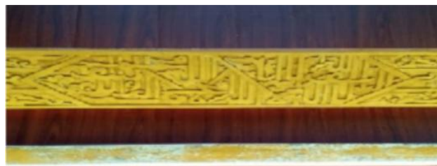
Foto 6. Tampak ukiran kaligrafi.