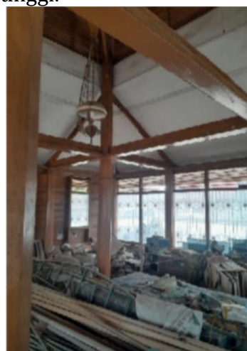
Foto 1. Barang-barang yang disimpan di dalam Masjid Tuha Lueng Bata.

Masjid Tuha Lueng Bata terletak di Gampong Batoh, Kecamatan Lueng Bata, Kota Banda Aceh. Lokasinya berdekatan dengan fasilitas umum dan permukiman penduduk. Kondisi fisik bangunan saat ini memprihatinkan karena telah dialihfungsikan menjadi gudang penyimpanan barang-barang yang tidak terpakai. Padahal, sebelumnya masjid ini digunakan sebagai tempat pengajian Al-Qur'an, sehingga kondisinya mencerminkan kurangnya perhatian pelestarian warisan budaya yang memiliki nilai historis dan edukatif tinggi.