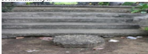
Foto 8. Tampak Tangga dengan Batu Bulat pada bagian bawah tangga Kompleks Makam Raja Jalil

satu anak tangga, terdapat sebuah batu berbentuk bulat dengan ornamen garis di permukaannya.