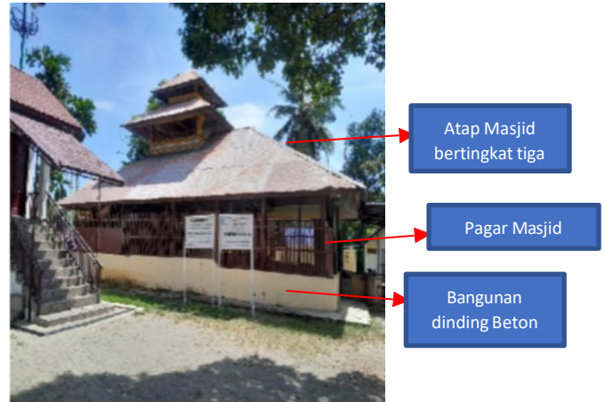
Foto 3. Atap Masjid, jendela dan bangunan bagian bawah

Arsitektur Masjid Tuha Bueng Sidom menunjukkan karakteristik tradisional Aceh yang kuat yang mencerminkan perpaduan antara kearifan lokal dan pengaruh budaya Islam baik dilihat dari bentuk bangunan ataupun ornament ukiran pada Masjid. Masjid Tuha Bueng Sidom juga menampilkan ciri khas dari Masjid Kuno nusantara seperti beratap tumpang, bertingkat tiga (Abdul, 2024). Komposisi material dan bentuk bangunan tersebut merupakan ciri bangunan yang lahir pada abad ke 16-18 Masehi (Tjandrasasmita, 2009). Elemen arsitektural berupa atap tumpang beringkat tiga tidak hanya memiliki fungsi struktural, tetapi juga makna simbolik. Ketiga tingkatan atap tersebut menggambarkan konsep akidah Islam (Wuri Handoko, 2013,) yaitu tahapan spiritual manusia dalam mendekati diri kepada Tuhan: dari dunia (tingkat pertama), menuju alam ruhani (tingkat kedua), dan akhirnya menuju kedekatan ilahiah (tingkat ketiga).