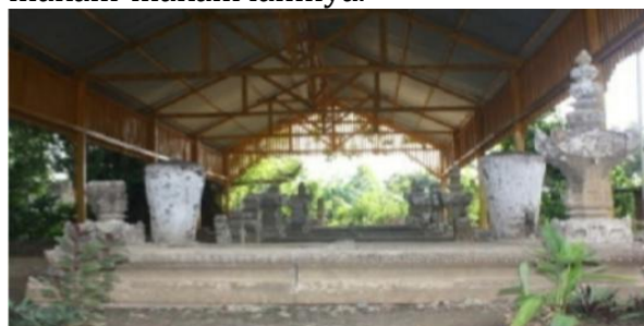
Foto 7. Tampak Makam-Makam Di Kompleks Makam Raja Jalil.

Kompleks Makam Raja Jalil terletak di Desa Lamlagang, Kecamatan Banda Raya, Kota Banda Aceh. Lokasinya berada di antara perumahan penduduk dan telah ditetapkan sebagai salah satu situs cagar budaya di Kota Banda Aceh. Secara keseluruhan, kompleks ini merupakan area berpagar tembok yang di dalamnya terdapat makam Raja Jalil beserta makam-makam lainnya.