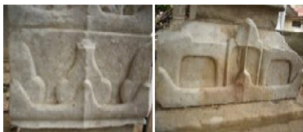
Foto 10. Motif Buengong Pucok Reubong Berkelopak Dua