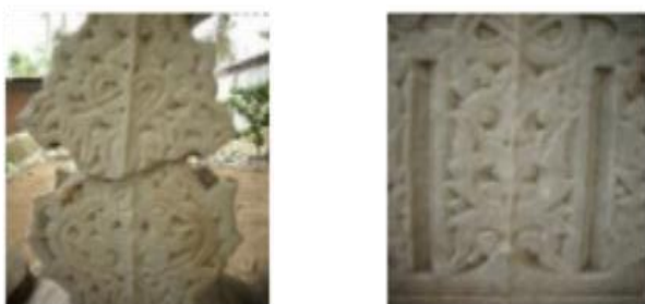
Foto 9. Motif Buengong Awan-Awan