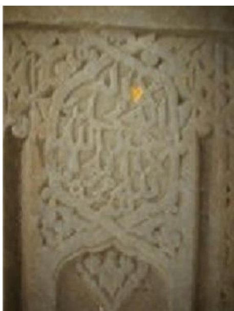
Foto 11. Ukiran Kaligrafi Kalimah Syahadat