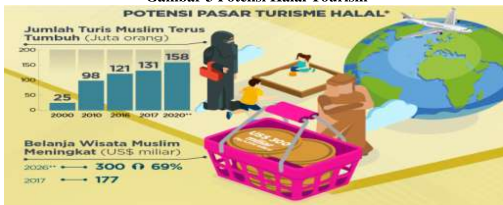
Gambar 3 Potensi Halal Tourism

Laporan Mastercard Crescentrating Global Travel Market Index (GMTI) menunjukkan data pertumbuhan dan proyeksi kunjungan wisatawan Muslim dunia akan terus meningkat setelah terjadinya penurunan selama pandemic Covid-19. Pada tahun 2028 diproyeksikan kedatangan wisatawan Muslim akan meningkat hingga 230 juta kedatangan dengan spending mencapai USD225 miliar (Gamal, 2022)