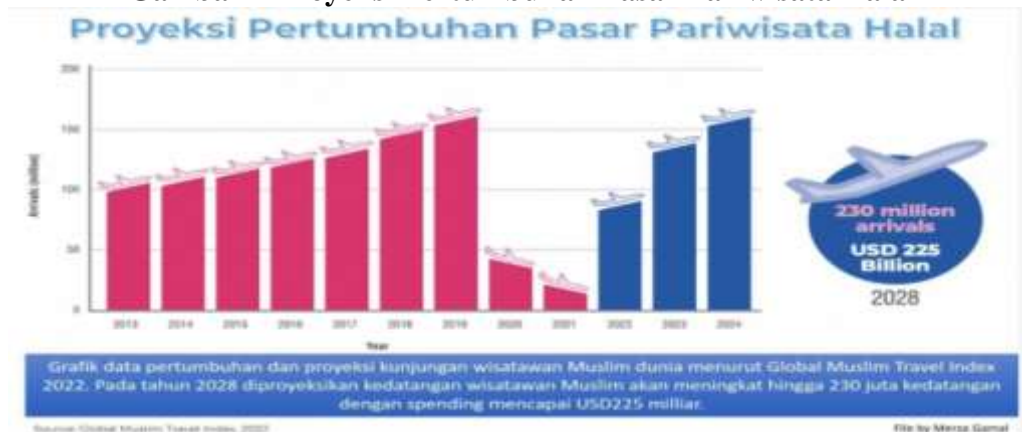
Gambar 2 Proyeksi Pertumbuhan Pasar Pariwisata Halal

negara-negara muslim tetapi secara global dan berupaya memperkenalkan wisatanya dengan konsep halal (Fadhlan & Subakti, 2020).