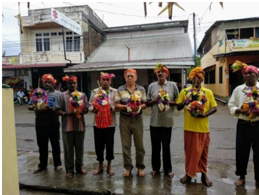
Gambar 1. Umat bersiap-siap untuk pemujaan sebelum Thaipusam .

e. Pada hari Minggu pagi, dilaksanakan ritual menusuk diri dengan “ vel ” yaitu mata pancing, anak panah atau besi. Ritual ini hanya dilakukan bagi orang-orang yang bernazar. Sebelum melakukan ritual ini, umat yang akan menusuk diri terlebih dahulu membersihkan dirinya dengan mandi di Sungai Krueng Aceh.