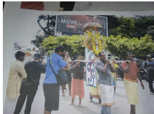
Gambar 4. Radhem , tandu yang dibuat untuk membawa replika arca Dewa Murugan.