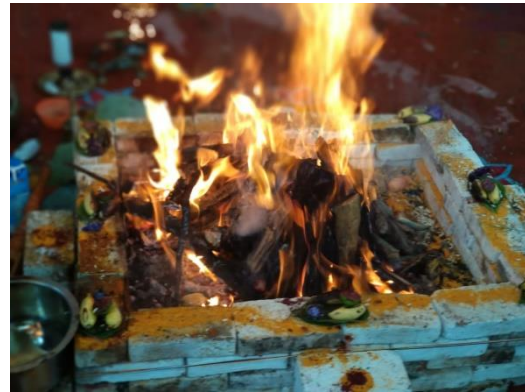
Gambar 3. Bak untuk ritual pengapian.